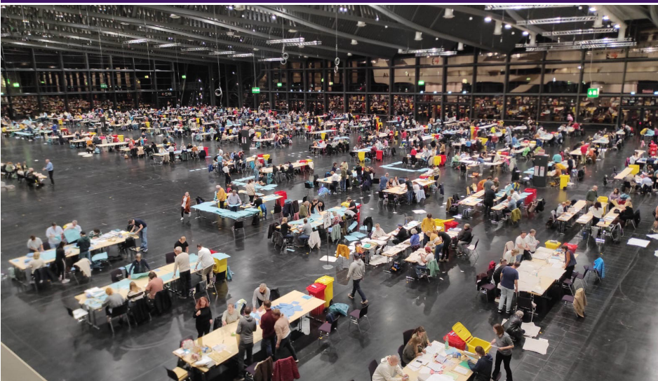
Bild 1: Landtags- u. Bezirkswahl 2023 – Briefwahlzentrum in der Nürnberg Messe