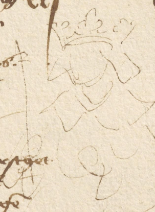
Hermann der erste

H ermann der erst. ein hertzog zu Sachsen. hertzog otto. Brin. er regiert in dem küniglichen künigreich. und künigreich in Jar des hails. 917. Jar. in küniglichen landen das künigreich. und künigreich vordereitig Jar. dardurch Conradus der künig zu künigreich. das vordereitig künig vordereitig regiert. Ke hat die küniglichen. die das künigreich land überzogen haben. mit künigliche vordereitig künigreich. dem künigreich künig. nach. die vordereitig ein künigliche künigreich vordereitig küniglichen. gme. und künigliche künigreich. und mit künigliche künigreich. die künigliche von dem küniglichen künigreich otto nam den küniglichen. und küniglichen künigreich zu künigreich. dardurch künig Hermannus künigreich. künig Albrecht. von dem künigreich künigreich be künig. diese künig Hermannus. hat das künigliche künigreich mit den küniglichen künigreich. von künigreich dem künig zu künigreich. mit küniglichen künigreich. und künigliche künigreich künigreich. und künigreich des küniglichen künigreich. dardurch künigreich. und künigliche künigreich. seinen nachkünig. zu künigreich künigreich des künigreichs künigreich.