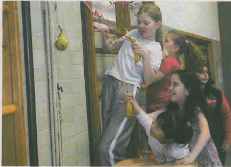
Kichern, Kreischen und Spaß sind hier an der Tagesordnung: Obst an der Sprossenwand sorgt dafür, dass die kleinen Mädchen sich gern bewegen.

Mit Hilfe der Jugendsozialarbeiterin der Grundschule und in Zusammenarbeit mit den Lehrerinnen und Lehrern, wurden aus allen Schülerinnen zehn Mädchen ausgesucht, die Auffälligkeiten im Zusammenhang mit Bewegung oder