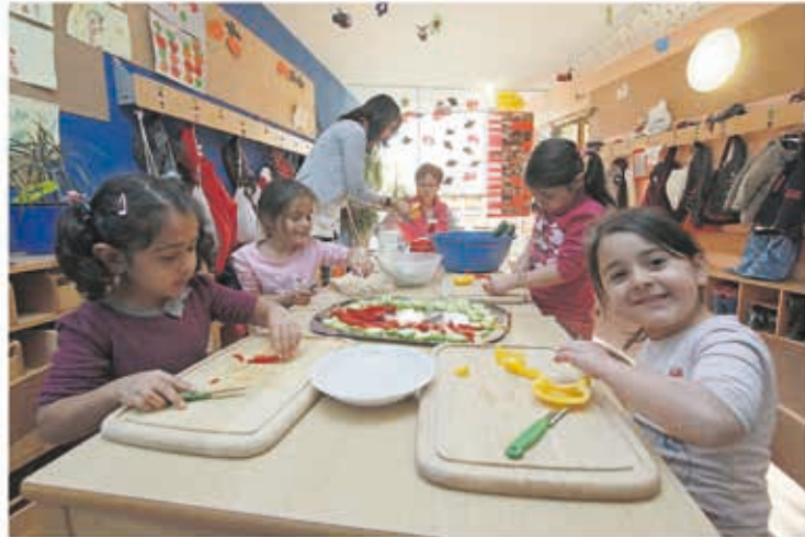
Bei der „Frühstücks-Oase Olgastraße“ helfen alle mit: Hier schneiden Kinder rote und gelbe Paprika klein.

Wegen der sozial schwierigen Verhältnisse in St. Leonhard und Schweinau werden die Stadtteile über das