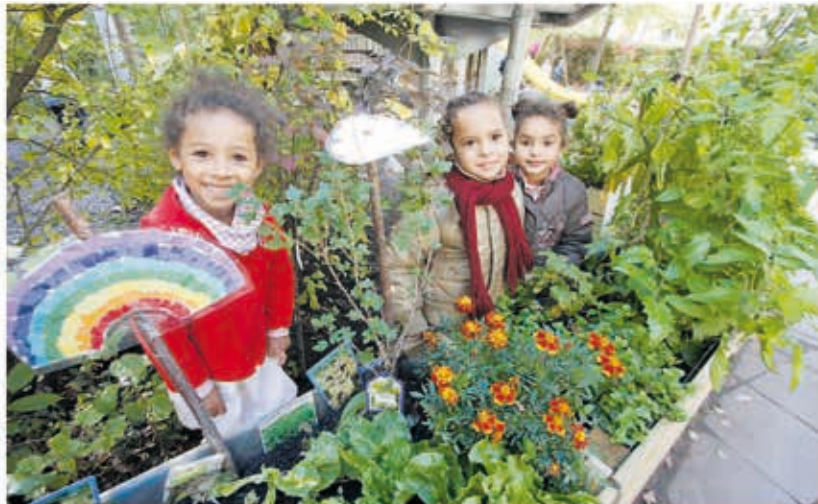
Hier wachsen Tagetes, Salat, Kräuter und Tomaten: Voller Stolz präsentieren die Kinder ihre neuen Hochbeete.

Damit möglichst viele Pflanzen möglichst lange gedeihen, haben sich die Kinder mit der Natur an sich auseinandergesetzt: „Allerlei bekamnt ist ja die Angst vor Bienen. Unsere Sprosslinge wissen: Die Insekten sind wichtig, da sie die