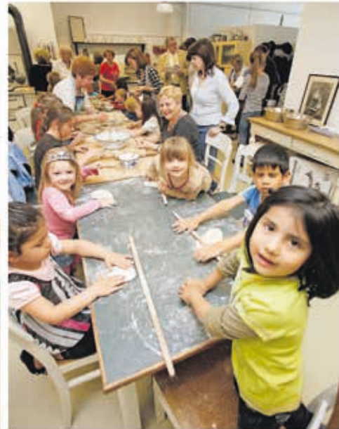
Mit wem macht Kochen am meisten Spaß? Klar, mit Mama oder Oma. Deshalb haben im Kindermuseum russische und türkische Mütter und Großmütter mit dem Nachwuchs gekocht.