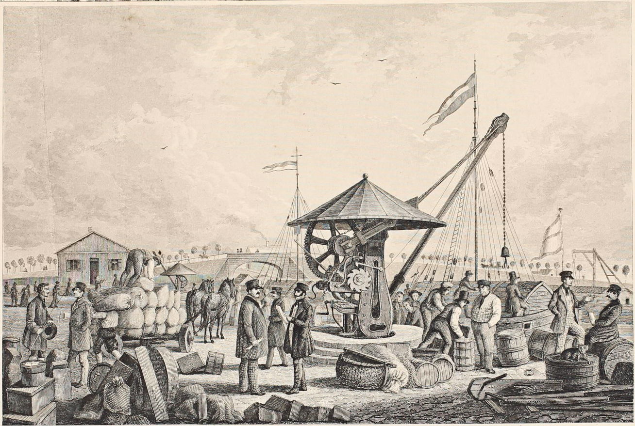
Der große Kraken am KANALHAFEN zu NÜRNBERG.