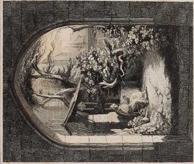
KARTEHAUSE ZU NÜRNBERG.