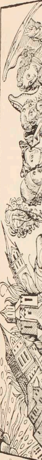
Gent, Hund Eck