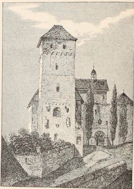
Der Heidenturm auf der Burg.

Bald nach Beginn des 15. Jahrhunderts trat in dem Verhältnis zwischen der Burg und der Stadt eine Veränderung ein, welche mit einem für die spätere Entwicklung der deutschen Verhältnisse höchst bedeutsamen Ereignis zusammenhing. König Sigismund, der