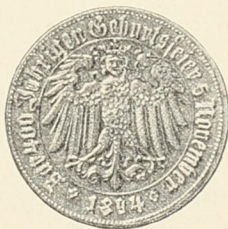
Denkmünzen, welche die Festleitung prägen liess.