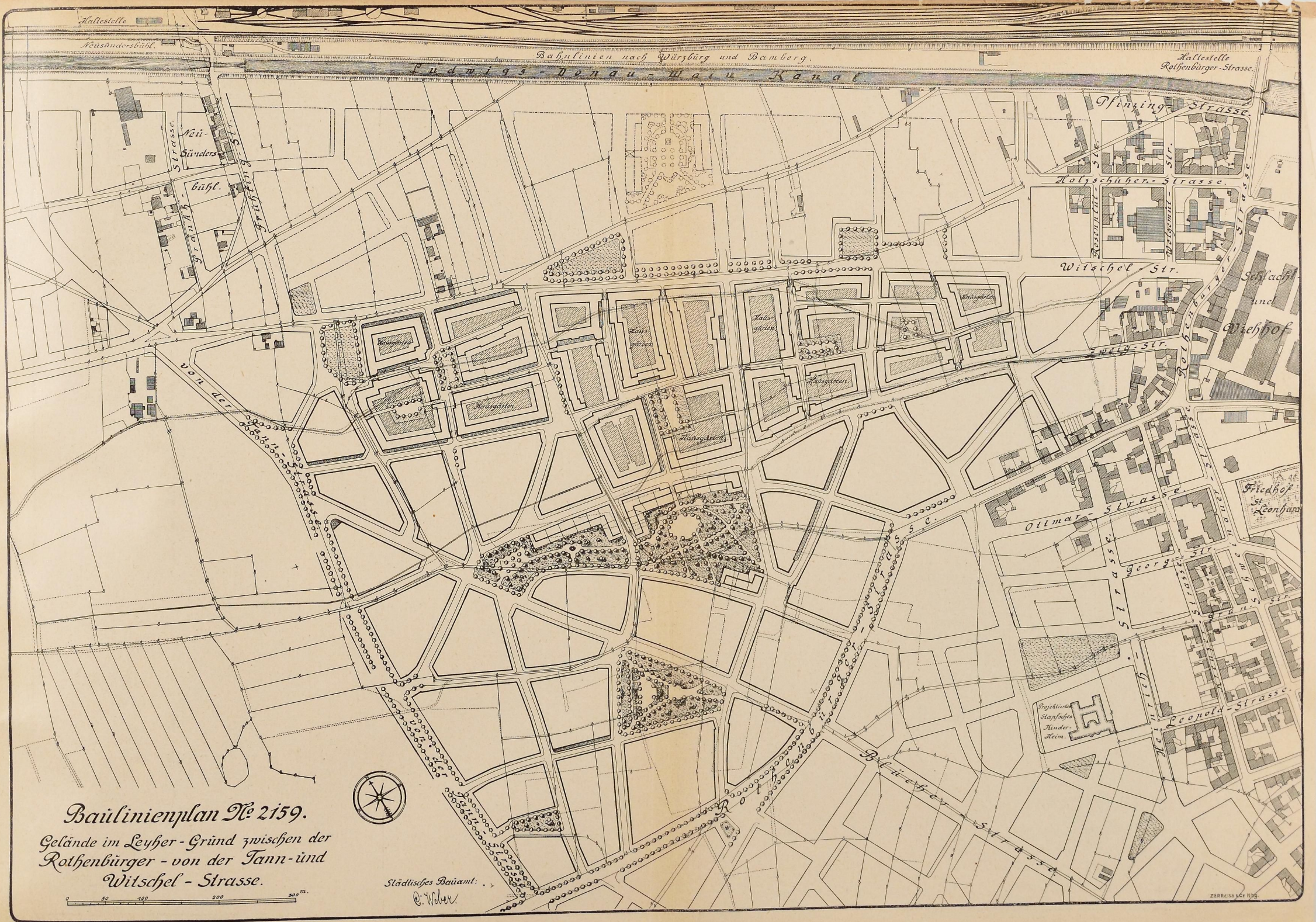
Bauplan Nr. 2159. Gelände im Leyher-Grund zwischen der Rothenbürger - von der Tann- und Witschel - Strasse.